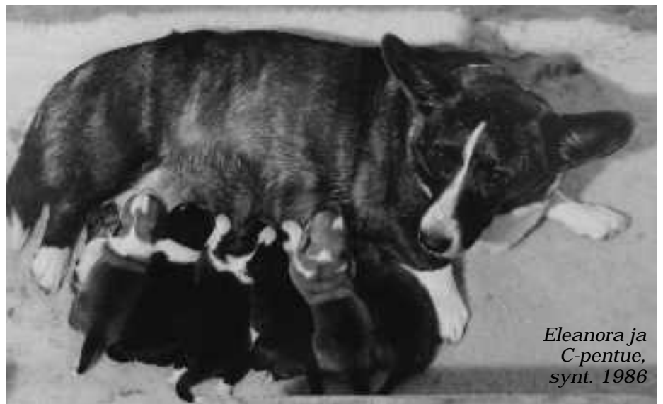
Eleanora ja C-pentue, synt. 1986