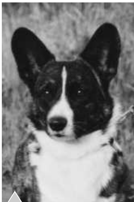
Big-Wood's Kiwi Bj-Jr